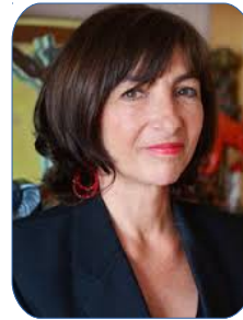
Préfète Sophie Brocas