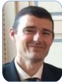
Sous-préfet de Nogent-le-Rotrou Christian Védélago