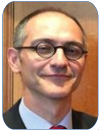
Sous-préfet de Châteaudun Emmanuel Baffour